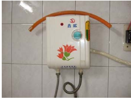
電(太陽能)熱水器圖示(無通風問題)