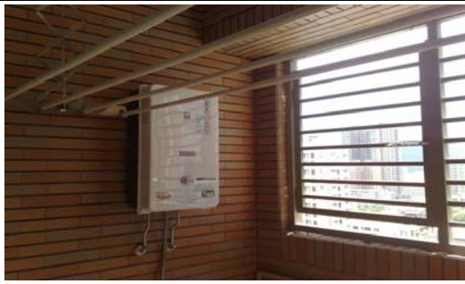
瓦斯熱水器圖示 1(要通風)