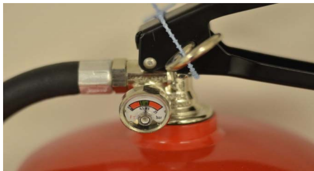
a. 乾粉滅火器壓力表