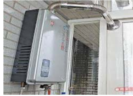
瓦斯熱水器圖示 2(不通風，要排風)