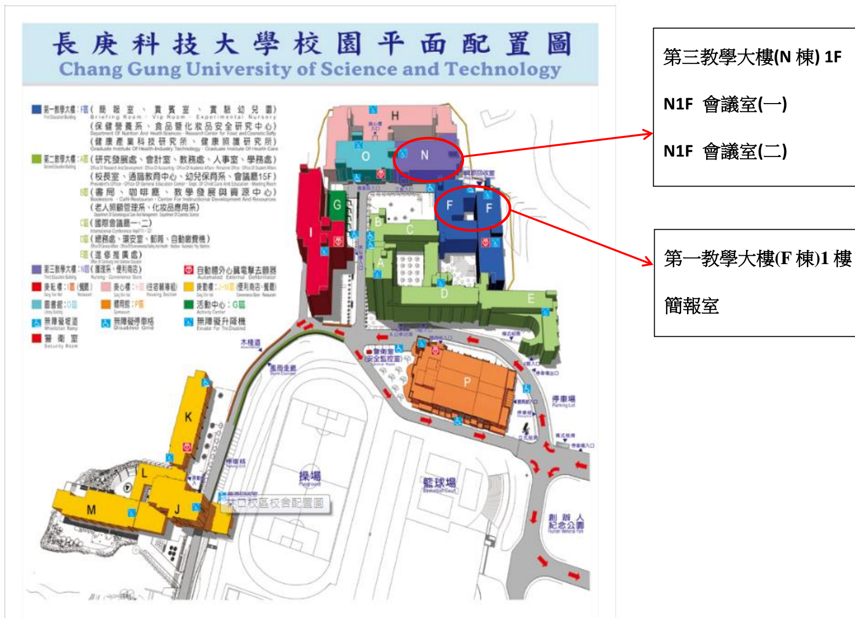
林口校區平面配置圖