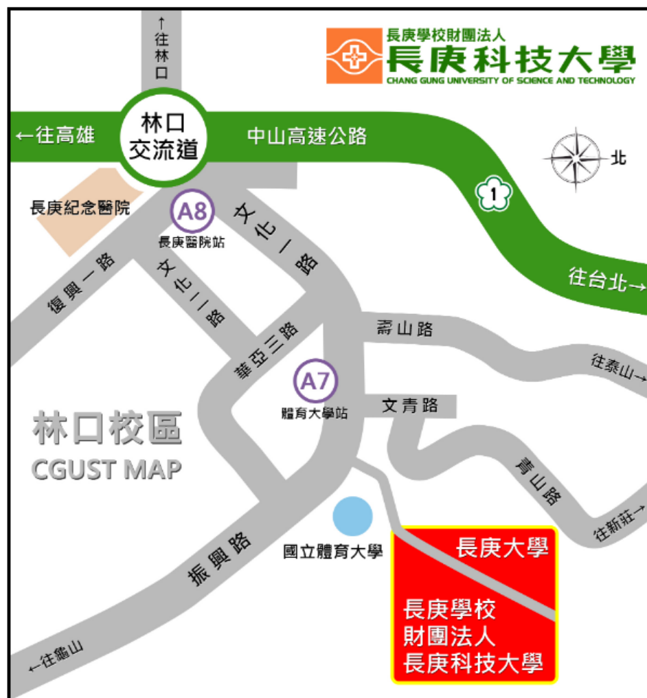
林口校區地理位置